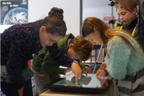
Abbildung 1: Kinder am Multitouch-Tisch

Ein Multitouch-Display ist ein Monitor mit einer touchsensitiven Oberfläche, welche die Nutzung mehrerer Eingabepunkte gleichzeitig erlaubt. Wie in vielen Laptops und Tablets findet man auch in den meisten Multitouch-Displays eine Kamera und Lautsprecher eingebaut.