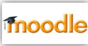
Abbildung 1: Moodle-Logo