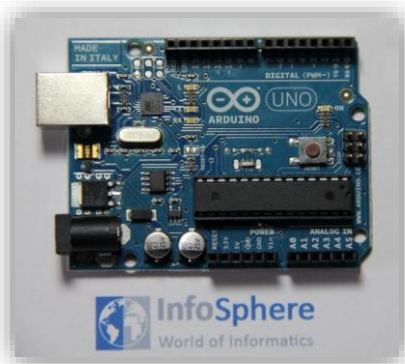
Abbildung 2: Arduino Uno

Der ARDUINO wird per USB mit dem Computer verbunden, hierüber erhält er sowohl die Programme als auch die Stromversorgung. Sollten sehr stromhungrige Verbraucher über den ARDUINO betrieben werden, ist eventuell ein externes Netzteil nötig. Es kann auch eine Batterie angeschlossen werden.