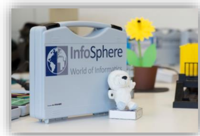
Abbildung 3: InfoSphere-Kit

Das Ansteuern eines digitalen Pins erfolgt über den Befehl digitalWrite(<pinNumber>, HIGH) , das Auslesen über die Funktion digitalRead(<pinNumber>) . In Kombination mit dem Befehl delay(<time>) sind Schüler schon in der Lage, eine ganze Reihe an Programmen zu schreiben (z. B. eine Ampelsteuerung oder einen Geschwindigkeitsmesser).