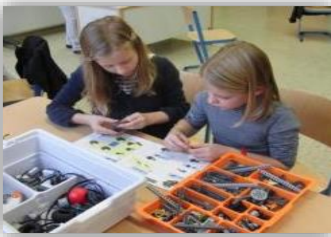
Abbildung 2: Mädchen beim Aufbau

Weiterhin wird im Modul Smartphone-App zur Fernsteuerung eines Roboters eine Fernsteuerungs-App für ein Smartphone entwickelt, die per Bluetooth einen NXT-Roboter steuert. Hier zeigen sich die gute Kompatibilität sowie die vielfältigen Einsatzmöglichkeiten der NXTs.