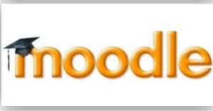
Abbildung 1: Moodle-Logo