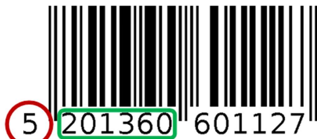
Abbildung 2: Aufbau der linken Codehälfte